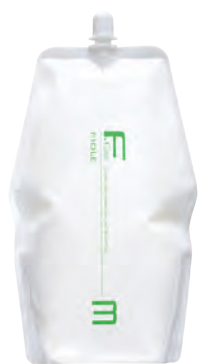
フィヨレ Fカラー BLカラー OX3 第2剤 染毛補助剤 1,000mL / 2,000mL 業務用 / 医薬部外品