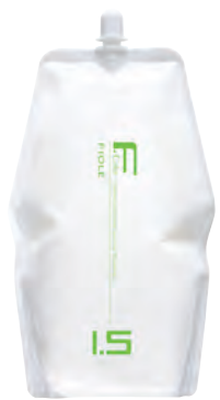
フィヨレ Fカラー BLカラー OX1.5 第2剤 染毛補助剤 2,000mL 業務用 / 医薬部外品