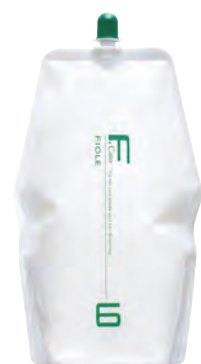
フィヨレ Fカラー BLカラー OX6 第2剤 染毛補助剤 1,000mL / 2,000mL 業務用 / 医薬部外品