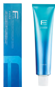
フィヨレ Fカラー クオルシア 第1剤 染毛剤 / 脱色剤 120g 業務用 / 医薬部外品