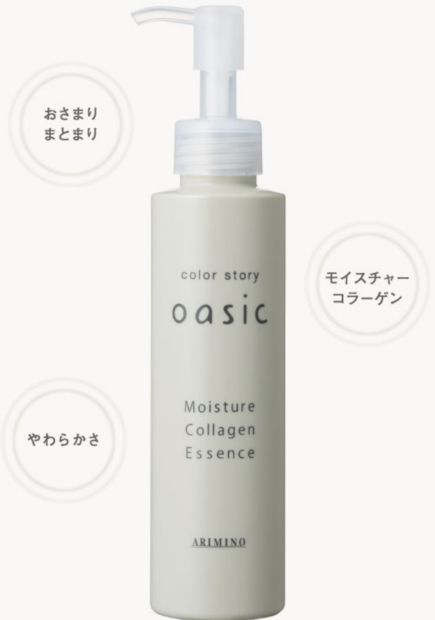
カラーストーリー オアシック MCエッセンス 140mL

コラーゲン配合エッセンスで、潤いや毛先におさまり感を与えます。 ミディアム・ロングの方のバサついた毛先や、 パーマ併用の中間毛から毛先にも。 ※カップに入れてご使用ください(10:1)の組み合わせ